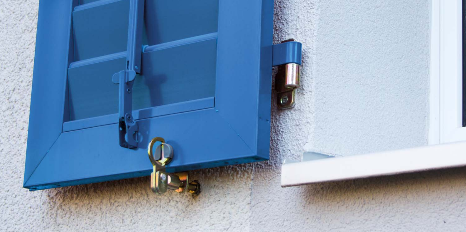
Staffe di montaggio TRA-WIK®-ALU-RF / -RL